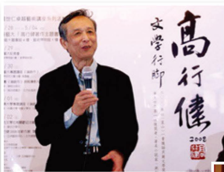
高行健先生4月29日在臺藝舉行記者會

此次「2008高行健文學行腳」系列活動的舉辦，除溫世仁文教基金會的極力贊助與各藝文機構合作協助之外，更重要的是黃光男校長、張浣芸副校長全力支持，委由秘書室與人文學院趙慶河院長的統籌規劃，在全校同仁的通力配合之下，終能完成此項任務。藝術創作並非空想，而是需要內心深刻的沈潛，誠如高行健先生所謂：藝術需要跨越既有的框架，文學、戲劇、繪畫都是藝術所要表達的方式，唯有成為不受限制的藝術創作，才能有不斷突破的可能。