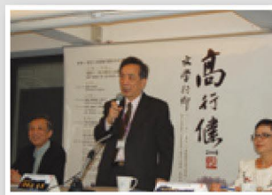
臺藝大記者會由黃光男校長、張浣芸副校長共同主持，熱烈歡迎高行健先生訪校演講