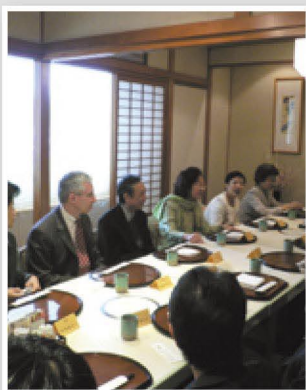
高行健先生、西零女士偕同貴賓與好友於福華飯店午餐