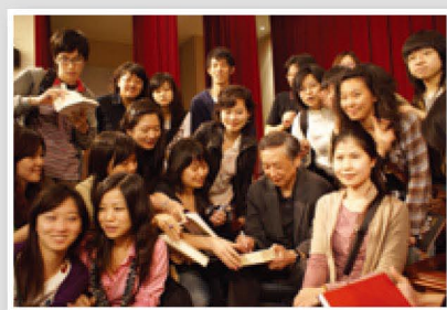
高行健先生在本校演講時，全校師生為一睹大師風采，熱情地擠爆演講會場